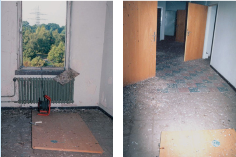
Abbildungen: 3 a, b. Taubenkotkontamination, die gut absaugbar ist

Die Reinigung dieser Arbeitsbereiche sollte daher nicht unter Verwendung von Schaufeln und Besen, Hochdruckreinigern oder durch Abbürsten (s. Abbildung 2) geschehen, da Mikroorganismen bei den beschriebenen Tätigkeiten zusammen mit Staub- oder Flüssigkeitspartikeln verstärkt in die Luft freigesetzt werden.