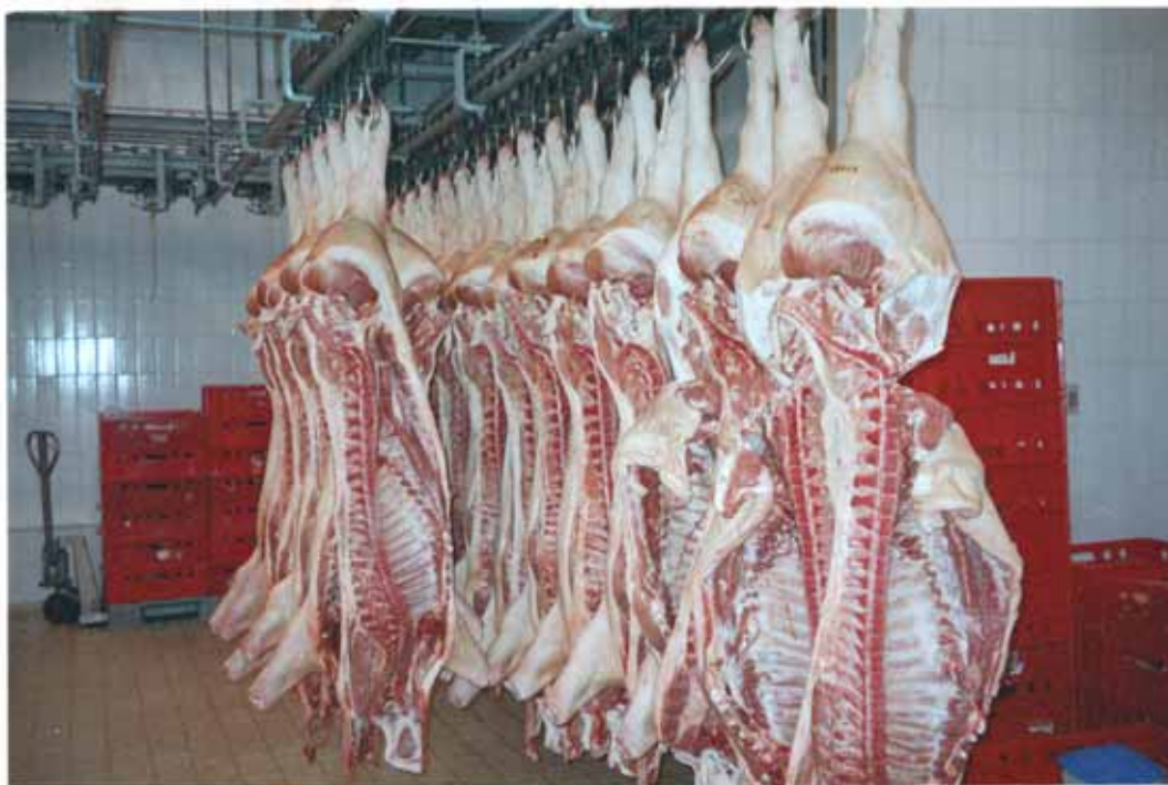
Nicht gezielte Tätigkeit mit biologischen Arbeitsstoffen in der Lebensmittelproduktion