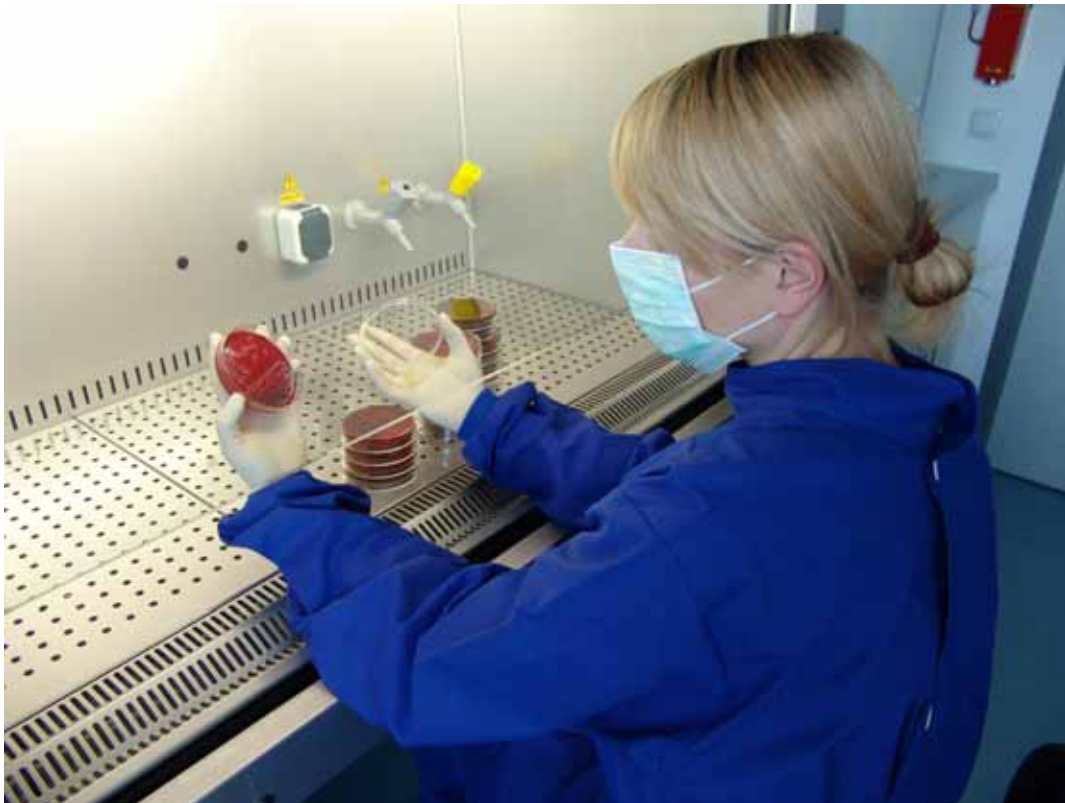
Gezielte Tätigkeit mit biologischen Arbeitsstoffen in der Mikrobiologie

Die erforderlichen Schutzmaßnahmen sind in den Anhängen II bis III der Biostoffverordnung unter der jeweiligen, im 2. Schritt ermittelten Schutzstufe wiedergegeben. Unabhängig davon sind immer die allgemeinen Hygienemaßnahmen der Schutzstufe 1 festzulegen.