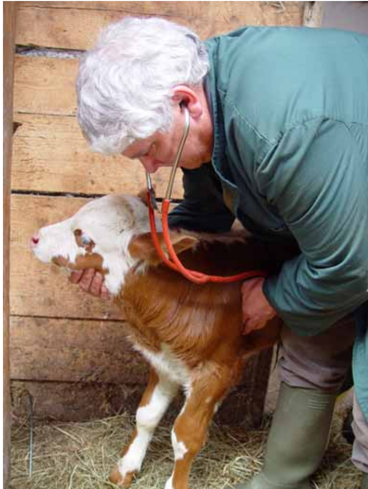
Nicht gezielte Tätigkeit mit biologischen Arbeitsstoffen bei der Untersuchung von Tieren

Bei den arbeitsmedizinischen Vorsorgeuntersuchungen sind zu unterscheiden: