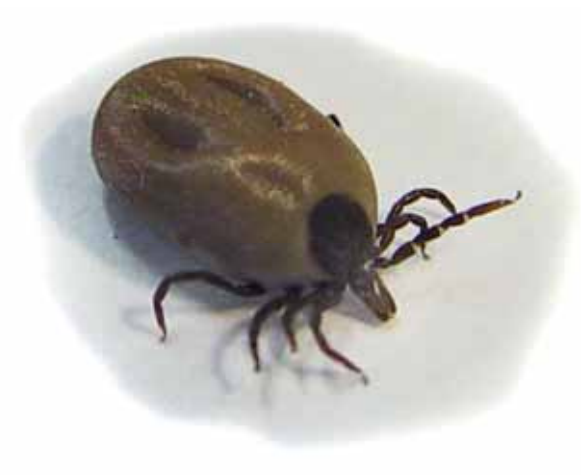
Ixodes ricinus als Vektor für die Übertragung von FSME-Virus und Borrelien