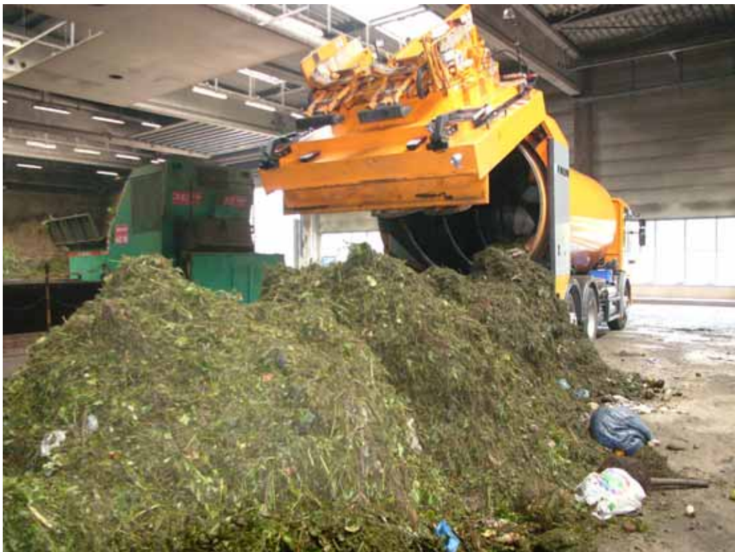
Nicht gezielte Tätigkeit mit biologischen Arbeitsstoffen bei der Anlieferung von Bio-Abfall

Das Ergebnis der Gefährdungsbeurteilung ist in Schriftform festzuhalten und muss der zuständigen Aufsichtsbehörde auf Verlangen vorgezeigt werden. Unter bestimmten Voraussetzungen kann auf eine schriftliche Dokumentation verzichtet werden (siehe S. 4 f).